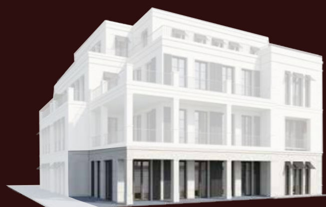
ANSICHT RHEINVILLEN - RHEINSEITE